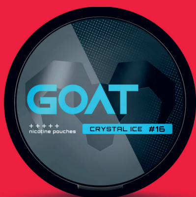
23519000 GOAT Crystal Ice #16 Chladivý mentol