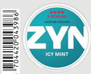
23517200 Zyn X-Strong 11mg Icy Mint Q 5 ks / balení