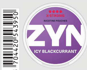
23517300 Zyn X-Strong 11mg Icy Blackcurrant 5 ks / balení