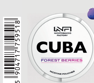
23483300 Cuba White 16mg Forest Berries Q 10 ks / balení