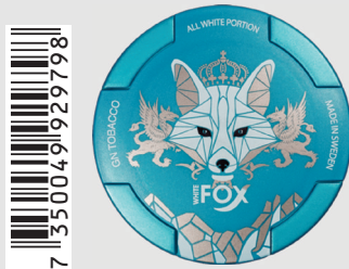
23513200 White Fox 12mg Q 10 ks / balení