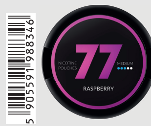
23516800 77 16mg Raspberry Medium Q 10 ks / balení