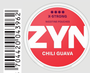
23517400 Zyn X-Strong 11mg Chili Guava Q 5 ks / balení