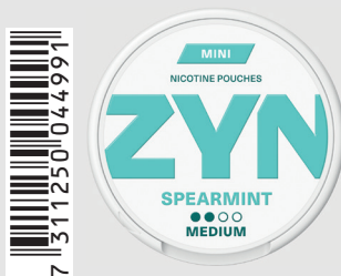
23517600 Zyn Mini Medium 3mg Spearmint Q 5 ks / balení