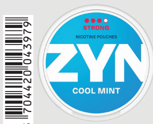
23517100 Zyn Strong 9mg Cool Mint Q 5 ks / balení