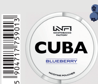
23483100 Cuba White 16mg Blueberry Q 10 ks / balení