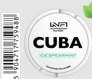
23483500 Cuba White 16mg Ice Spearmint Q 10 ks / balení

TENTO VÝROBEK OBSAHUJE NIKOTIN, KTERÝ JE VYSOCE NÁVYKOVOU LÁTKOU