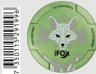
23513300 White Fox 12mg Peppered Mint Q 10 ks / balení

Tento výrobek obsahuje nikotin a je vysoce návykový.