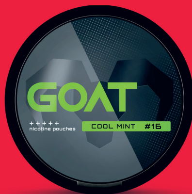
GOAT Cool Mint #16 Peppermint