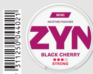
23518200 Zyn Mini Strong 6mg Black Cherry Q 5 ks / balení