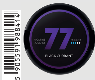
23516600 77 16mg Black Currant Medium Q 10 ks / balení