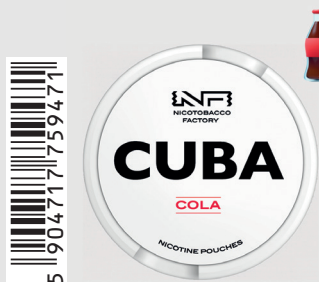
23483200 Cuba White 16mg Cola Q 10 ks / balení