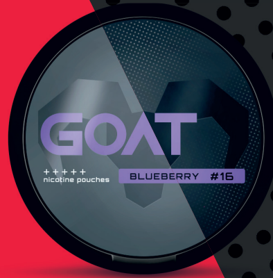
23488900 GOAT Blueberry #16 Borůvka