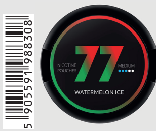
23516500 77 16mg Watermelon Ice Medium Q 10 ks / balení