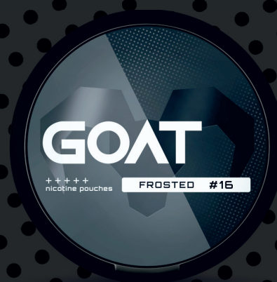
23489000 GOAT Frosted #16 Slaná