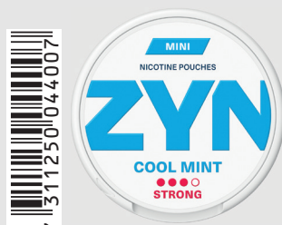
23517800 Zyn Mini Strong 6mg Cool Mint Q 5 ks / balení