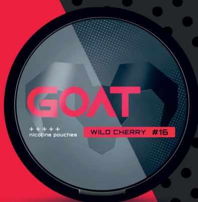
23488800 GOAT Wild Cherry #16 Divoká třešeň