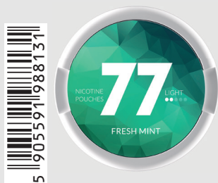
23516400 77 8mg Fresh Mint Light Q 10 ks / balení