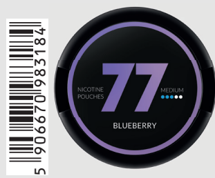
23516300 77 16mg Blueberry Medium Q 10 ks / balení