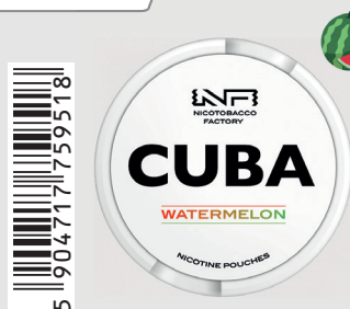
23483400 Cuba White 10mg Watermelon Q 10 ks / balení