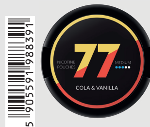
23516100 77 16mg Cola & Vanilla Medium Q 10 ks / balení