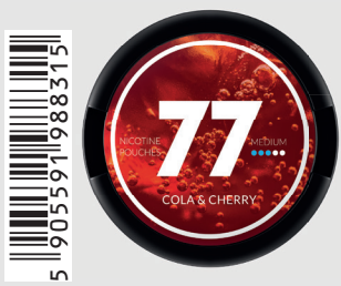
23516700 77 16mg Cola & Cherry Medium Q 10 ks / balení