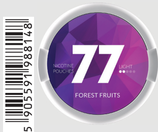
23516200 77 8mg Forest Fruits Light Q 10 ks / balení