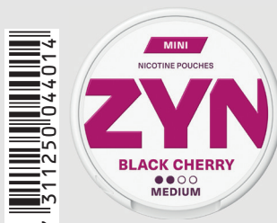
23518100 Zyn Mini Medium 3mg Black Cherry Q 5 ks / balení