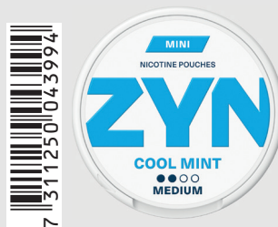
23517700 Zyn Mini Medium 3mg Cool Mint Q 5 ks / balení