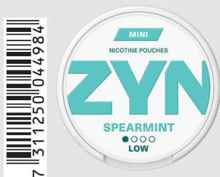
23517500 Zyn Mini Low 1,5mg Spearmint Q 5 ks / balení