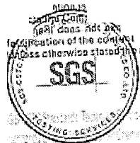
Allen Xie Ověřený podpis